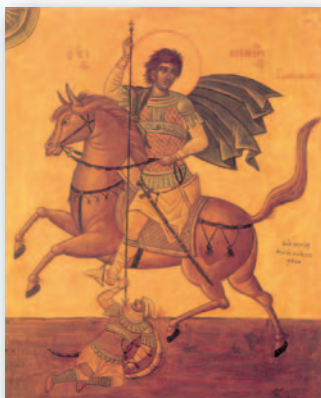
(Διά χειρός Φ. Κόντογλου)