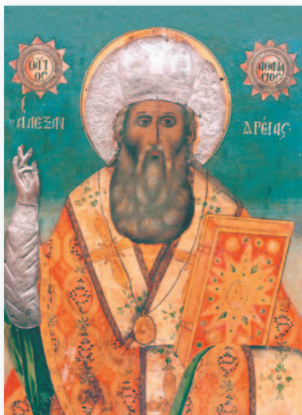
Εικόνα τοῦ Ἁγίου ἀπό τόν ὁμώνυμο Ἱ. Ναό στή Συκιά Χαλκιδικῆς